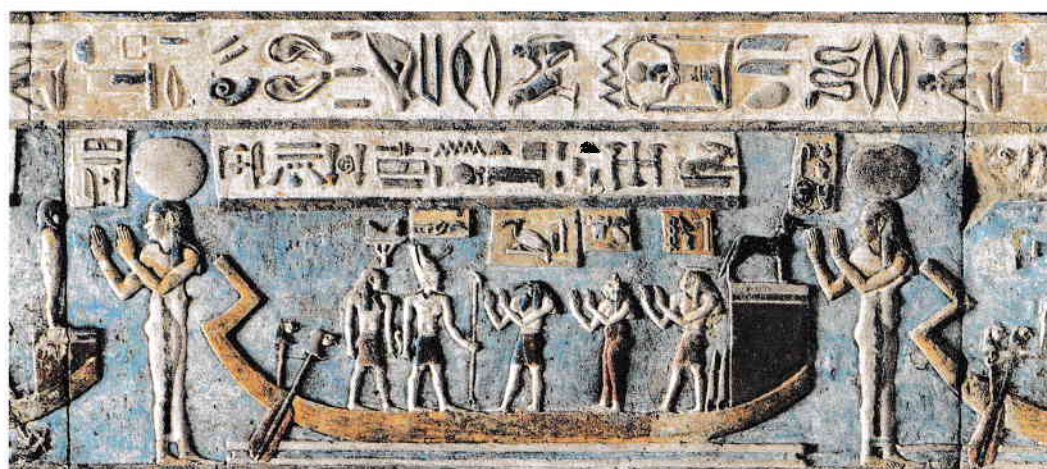
Basorelieful și hieroglifile din Templul lui Hathor (Dendera, Egipt)

Prima imprimărie de monede din lume a funcționat în regatul Lidia (Asia Mică), în sec. al VII-lea î.Hr. De aici, meșteșugul s-a răspândit în toată zona Mării Mediterane.