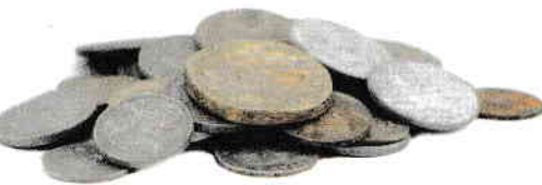
b. monede bizantine;