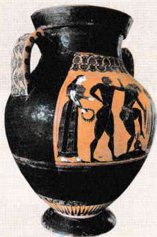
Vas antic grecesc