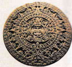
Calendarul tradițional mayaș, unul dintre cele mai vechi din istorie