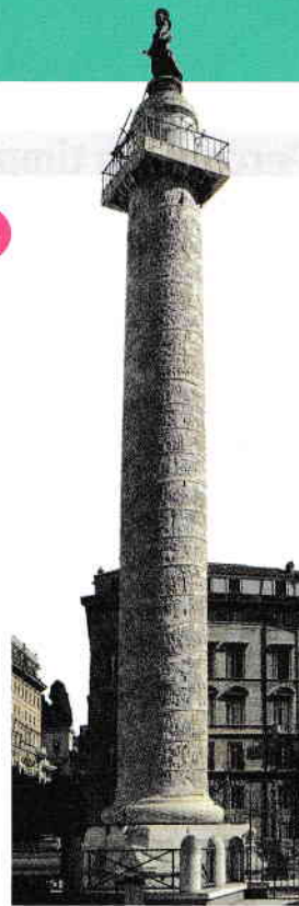
d. Columna lui Traian.

II. Citește cu atenție textul de mai jos, apoi rezolvă cerințele.