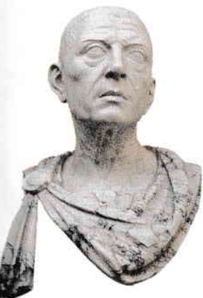
Gaius Iulius Cezar (100-44 î.Hr.) a reformat vechiul calendar roman, stabilind, în 46 î.Hr., unul nou.

III. Studiază cu atenție „axa timpului” de la pagina 12, apoi realizează una asemănătoare în caiet. Plasează, pe cea trasată de tine, în dreptul epocilor corespunzătoare, următoarele evenimente istorice: