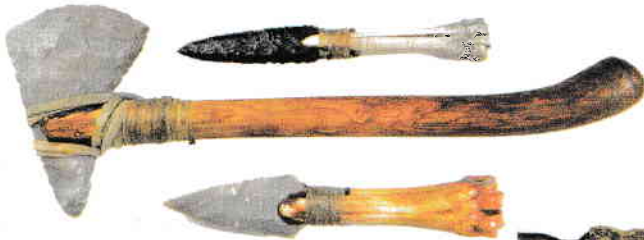
a. unelte preistorice;

Exemplu: a. Unelte preistorice sunt izvoare nescrise.