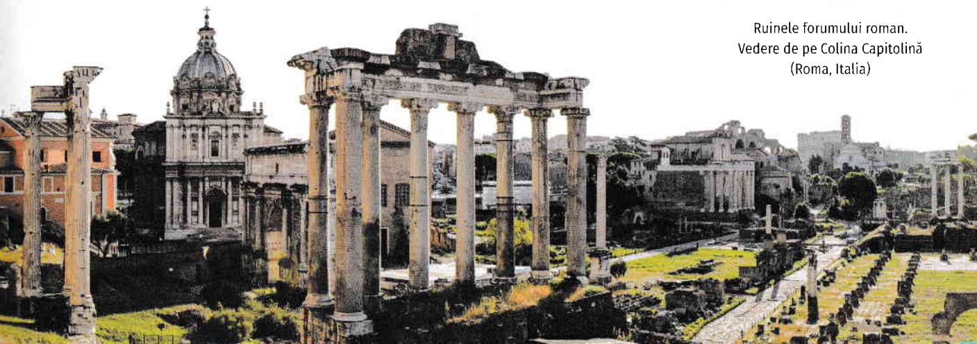
Ruinele forumului roman. Vedere de pe Colina Capitolină (Roma, Italia)

Notă: Pașii pe care trebuie să-i parcurgi atunci când realizezi investigația sunt enumerați la pagina 119 (METODE ȘI INSTRUMENTE DE LUCRU).